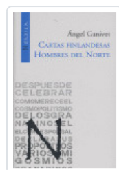
CARTAS FINLANDESES GANIVET, ANGEL