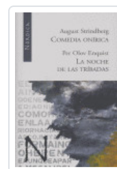
COMEDIA ONIRICA / NOCHE TRIBADAS STRINDBERG, AUGUST