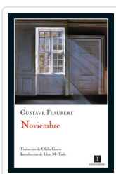
NOVIEMBRE FLAUBERT, GUSTAVE