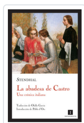
ABADESA DE CASTRO STENDHAL