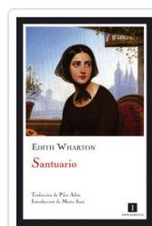
SANTUARIO WHARTON, EDITH