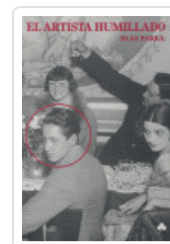
EL ARTISTA HUMILLADO PARRA, BLAS