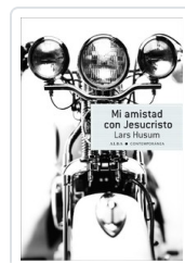
MI AMISTAD CON JESUCRISTO HUSUM, LARS