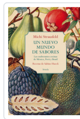
UN NUEVO MUNDO DE SABORES. EXUBERANTES COCINAS MEXICO, PERU STRAUSFELD, MICHI/ HUECK, SABINE