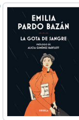
GOTA DE SANGRE, LA PARDO BAZAN, EMILIA