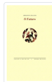
# O FUTURO GRAGERA, ABRAHAM