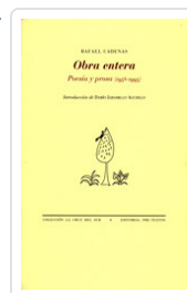
OBRA ENTERA POESIA Y PROSA 1958-1995 PT-874 CADENAS, RAFAEL