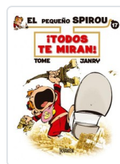
EL PEQUEÑO SPIROU CLYDE BENTON, JIM