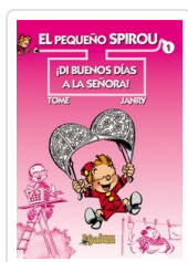
PEQUEÑO SPIROU, 1 DI BUENOS DIAS A LA SEÑORA TOME & JANRY