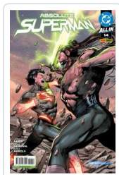
ABSOLUTE SUPERMAN, 2 AA.VV.