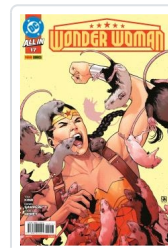
WONDER WOMAN, 3 AA.VV.