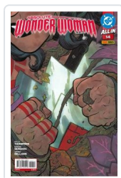
ABSOLUTE WONDER WOMAN, 2 AA.VV.