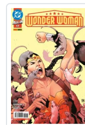
WONDER WOMAN, 3 AA.VV.