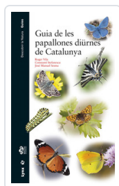
GUIA DE LES PAPALLONES DIURNES CATALUNYA VILA, ROGER