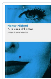
A LA CAZA DEL AMOR MITFORD, NANCY