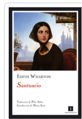
SANTUARIO WHARTON, EDITH