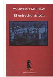
ESTRECHO RINCON MAUGHAM, SOMERSET