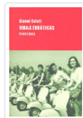
VIDAS ERRATICAS CELATI, GIANNI