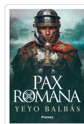
PAX ROMANA BALBAS, YEYO