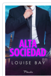
ALTA SOCIEDAD BAY, LOUISE