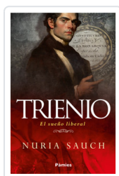
TRINIEN. EL SUENO LIBERAL SAUCH, NURIA