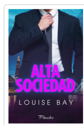
ALTA SOCIEDAD BAY, LOUISE