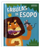
FABULAS DE ESOPPO