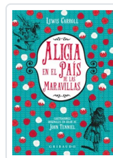
ALICIA EN EL PAIS DE LAS MARAVILLAS (NE) CARROLL, LEWIS