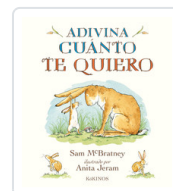
ADIVINA CUANTO TE QUIERO MCBRATNEY, SAM