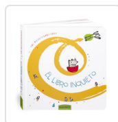
LIBRO INQUIETO, EL KRICKELKRAKELS