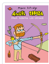
ANGEL SEÑA PARA ACERTAR LOS CATORCE ENTRIALGO, MAURO