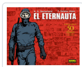
ETERNAUTA, EL OESTERHELD, H.G.