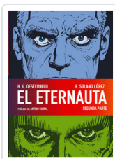
ETERNAUTA, 2 OESTERHELD, H.G.