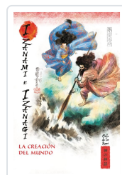
CREACION DEL MUNDO AA.VV.