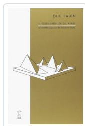
SILICONIZACION DEL MUNDO, LA SADIN, ERIC