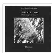
LLAMA A LA LLAMA. 20 AÑOS DE POESÍA VISUAL CALVO GALAN, AGUSTIN