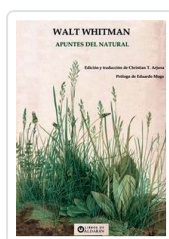
APUNTES DEL NATURAL WHITMAN, WALT