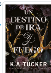
UN DESTINO DE IRA Y FUEGO (SAGA DESTINO Y FUEGO, 1) TUCKER, K.A.