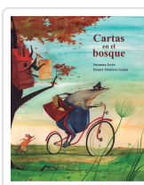
CARTAS EN EL BOSQUE ISERN, SUSANNA/ MONTERO, DANIEL