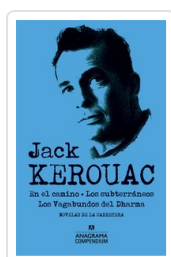
JACK KEROUAC (NOVELAS DE LA CARRETERA) KEROUAC, JACK