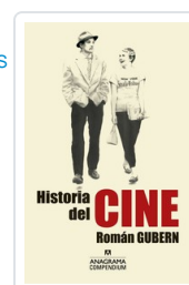
HISTORIA DEL CINE GUBERN, ROMAN