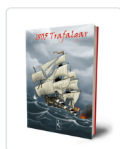
1805 TRAFALGAR OLIVARES, JULIAN