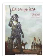
CONQUISTA, LA AA.VV.