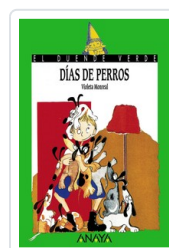
DÍAS DE PERROS VIOLETA MONREAL