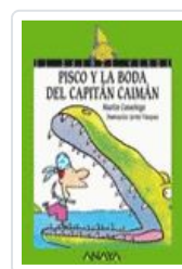
PISCO Y LA BODA DEL CAPITÁN CAIMAN MARTIN CASARIEGO