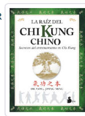
RAIZ DEL CHI KUNG CHINO YANG, JWING-MING