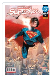
ABSOLUTE SUPERMAN, 2 AA.VV.