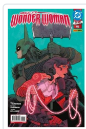
ABSOLUTE WONDER WOMAN, 2 AA.VV.