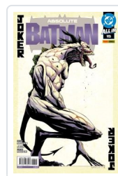
ABSOLUTE BATMAN, 2 AA.VV.