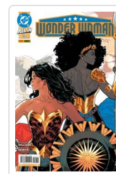
WONDER WOMAN, 3 AA.VV.