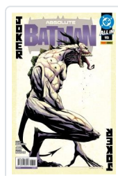
ABSOLUTE BATMAN, 2 AA.VV.