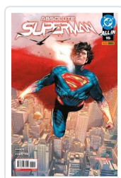
ABSOLUTE SUPERMAN, 2 AA.VV.