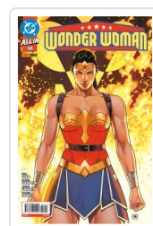
WONDER WOMAN, 3 AA.VV.