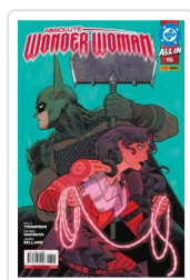
ABSOLUTE WONDER WOMAN, 2 AA.VV.