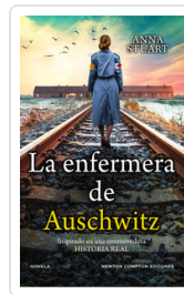
ENFERMERA DE AUSCHWITZ, LA STUART, ANA