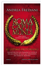
ULTIMO PRETORIANO, EL (ROMA CAPUT MUNDI) FREDIANI, ANDREA