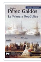
PRIMERA REPUBLICA BENITO PEREZ GALDOS