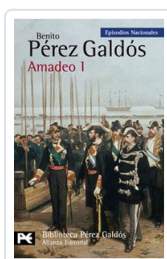
AMADEO I BENITO PEREZ GALDOS