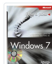
WINDOWS 7 JOAN PREPPERNAU