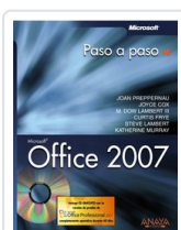
OFFICE 2007 JOAN PREPPERNAU