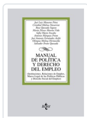
MANUAL DE POLÍTICA Y DERECHO DEL EMPLEO JOSE LUIS MONEREO PEREZ