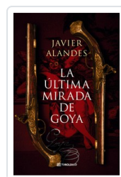
ULTIMA MIRADA DE GOYA, LA (BOL) ALANDES, JAVIER