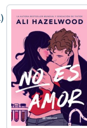
NO ES AMOR (BOL) HAZELWOOD, ALI