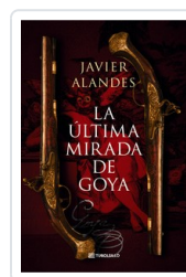
ULTIMA MIRADA DE GOYA, LA (BOL) ALANDES, JAVIER