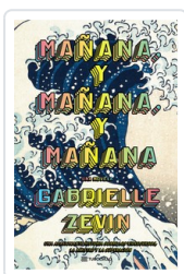
MAÑANA, Y MAÑANA, Y MAÑANA (BOL) ZEVIN, GABRIELLE