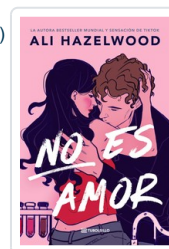
NO ES AMOR (BOL) HAZELWOOD, ALI