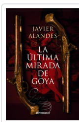
ULTIMA MIRADA DE GOYA, LA (BOL) ALANDES, JAVIER