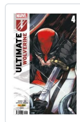
ULTIMATE WOLVERINE, 3 AA.VV.