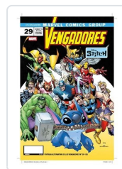
LOS VENGADORES,29 (PORTADA ALTERNATIVA DISNEY STICH) AA.VV.