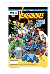
LOS VENGADORES,29 (PORTADA ALTERNATIVA DISNEY STICH) AA.VV.