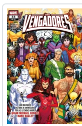
LOS VENGADORES,29 #V4,183 AA.VV.