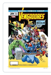
LOS VENGADORES,29 (PORTADA ALTERNATIVA DISNEY STICH) AA.VV.