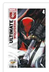
ULTIMATE WOLVERINE, 3 AA.VV.