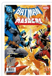
BATMAN/MASACRE, 1 AA.VV.