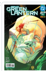
ABSOLUTE GREEN LANTERN, 7 AA.VV.