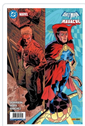
BATMAN/MASACRE PORTADA HAYDEN SHERMAN AA.VV.