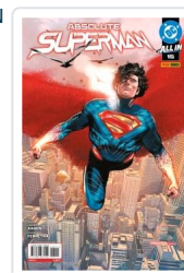
ABSOLUTE SUPERMAN,12 AA.VV.