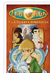
** LEO TITAN Y LA CUARTA DIMENSION CAPLAN, SAMUEL