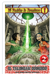
TU DECIDES, 2 TALISMAN COSMICO MURIEL, JOSE A.