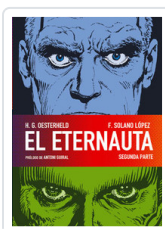
ETERNAUTA, 2 OESTERHELD, H.G.