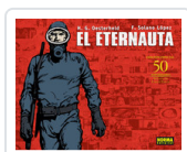
ETERNAUTA, EL OESTERHELD, H.G.