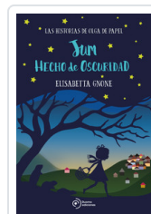
JUM HECHO DE OSCURIDAD GNONE, ELISABETTA