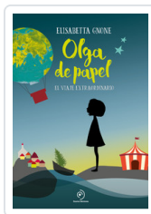
OLGA DE PAPEL GNONE, ELISABETTA