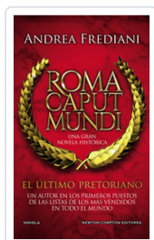
ROMA CAPUT MUNDI (ULTIMO PRETORIANO) FREDIANI, ANDREA