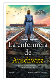
ENFERMERA DE AUSCHWITZ, LA STEUART, ANA