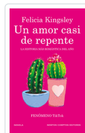
UN AMOR CASI DE REPENTE KINGSLEY, FELICIA