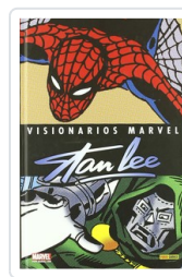
VISIONARIOS MARVEL: STAN LEE