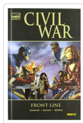
CIVIL WAR: FRONT LINE (MD) JENKINS