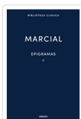
EPIGRAMAS II MARCIAL