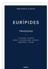
TRAGEDIAS I. EL CICLOPE. ALCESTIS. MEDEA. LOS HERACLIDAS. H EURIPIDES