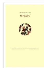
# O FUTURO GRAGERA, ABRAHAM