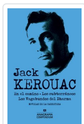
JACK KEROUAC (NOVELAS DE LA CARRETERA) KEROUAC, JACK